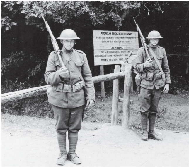
Bewachung des amerikanischen Brückenkopfes in Montabaur

Die französische und amerikanische Besetzung der Jahre 1918-1930 im Gebiet von Rheinland-Pfalz erscheint als eine von Not und Härte geprägte Zeit. Während damals die Wahrnehmung auf beiden Seiten von Vorurteilen und nationalistischer Agitation bestimmt war, spiegeln persönliche Zeugnisse ganz andere Erfahrungen wider. So gab es im zwischenmenschlichen Bereich durchaus Ansätze für Verständigung und Versöhnung. Die Wanderausstellung „Der gescheiterte Friede“, der gleichnamige Katalog und die regional ergänzende Website „ https://1914-1930-rlp.de “ möchten beides zeigen – die vielfältigen Belastungen, unter denen Deutschland wie auch Frankreich nach dem furchtbaren Weltkrieg litten, aber auch die versöhnlichen Entwicklungen, selbst wenn ein dauerhafter Friede erst nach 1945 realisiert werden konnte.